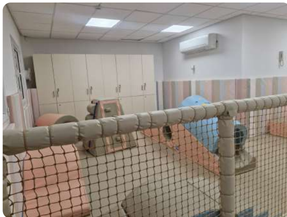
Abri après rénovation